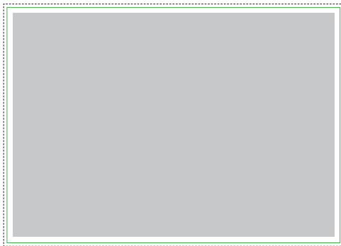
1:1 Vorlage auf Seite 2 und 3